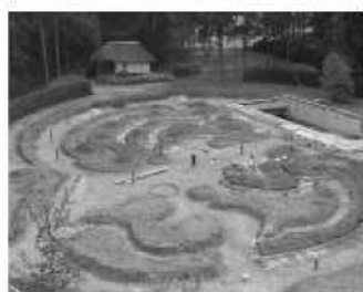
Rozgraniczanie całkowitej powierzchni